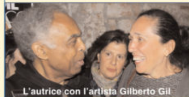
L'autrice con l'artista Gilberto Gil

Quindi i prodotti della Foresta Atlantica, zona boschiva che produce, tra l'altro, «cajã», «jaca», «graviola», «pitanga», «mangaba»; e quelli dell'entroterra nordestino, con carne essiccata, «manioca», «paçoca», «tapioca», e la cucina sertaneja. Degli indigeni i «beiju de tapioca», la «farofa», le ricette con mais e manioca. Del Sudest (Minas, Sampa, Rio e Espírito Santo) la cucina dei «tropiceros», i mulattieri, che giunsero solo dopo a divenire cuochi della cucina brasiliana: prima di essi, era mansione femminile.