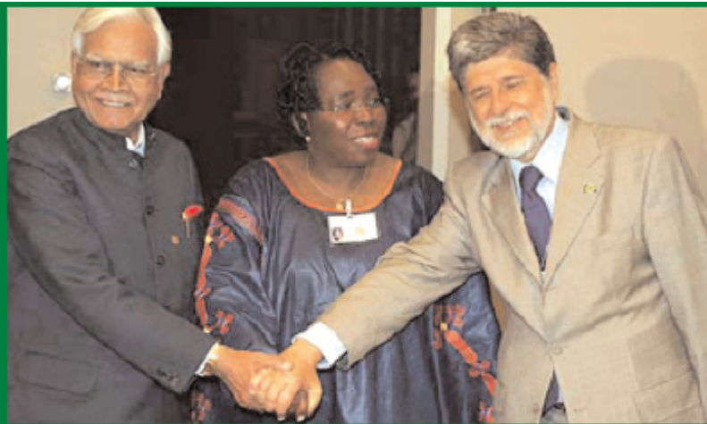
K. Natwar Singh, ministro degli Esteri indiano, Nkosazana Dlamini-Zuma, presidente della Commissione dell'Unione africana, e Celso Amorim