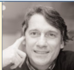
La mostra "Dancer inside Brazil" fino al 18 marzo nella Galleria Candido Portinari dell'Ambasciata del Brasile a Roma, Piazza Navona

R. Studiavo ed ero appassionato di filosofia, e a quei tempi il cinema non era solo arte: in Brasile esso costituiva un vero e proprio strumento di cambiamento sociale, di trasformazione. Il cinema ha fatto sì che i paulisti e i carioca, gli abitanti di San Paolo e di Rio de Janeiro, conoscessero il «Nordest» del Brasile e la sua povertà, ad esempio. Anche la politica era molto legata al cinema. Entrai però nella carriera diplomatica che ho condotto, insieme all'essere ministro, per oltre 50 anni. Ora tengo lezioni, partecipo a conferenze alle quali sono invitato o commissioni, anche nell'ambito delle Nazioni Unite, su questioni legate a problemi globali di salute ma anche calcio, perché siamo sempre brasiliani; sono stato capo dell'Osservatorio elettorale dell'Oea, l'Organizzazione degli Stati americani ad Haiti. Un libro è costituito da una prefazione, una storia ed un epilogo: io mi trovo nella fase dell'epilogo, ho sempre lavorato per lo Stato e per organismi internazionali, ma non lavorerei, pur rispettandola, in un'impresa privata. Sono servitore dello Stato. □