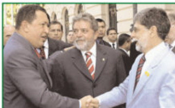
Nel 2003, Amorim con il presidente venezuelano Hugo Chávez e, al centro, l'allora presidente brasiliano Luiz Inácio Lula da Silva