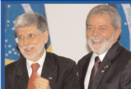
Amorim con l'ex presidente Lula, sopra, e, sotto, con la candidata alla presidenza americana Hillary Clinton, moglie dell'ex presidente Usa Bill Clinton