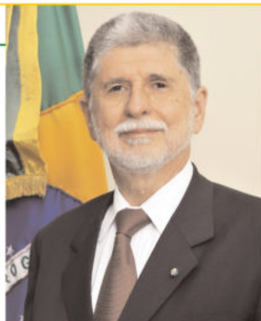
L'ambasciatore Celso Amorim, già ministro degli Affari esteri (Franco e Lula) e della Difesa (Dilma). Sotto, con il presidente Dilma Rousseff

Risposta. Direi innanzitutto di leggere i miei libri, perché in essi ho definito le priorità della politica estera brasiliana negli anni in cui sono stato ministro, soprattutto quelli in cui ho ricoperto tale incarico per il presidente Lula. Parlo delle relazioni del Brasile con l'America del Sud, ma anche con altri Paesi in via di sviluppo come l'India, il Sud Africa, della creazione del gruppo dell'Ibas, del Brics, dei rapporti del Brasile con i Paesi arabi, delle nostre iniziative o partecipazioni ad iniziative relative al Medio Oriente, del programma nucleare iraniano, in generale di tutti i temi più rilevanti quali le relazioni commerciali globali nell'ambito dell'Omc, l'Organizzazione mondiale del