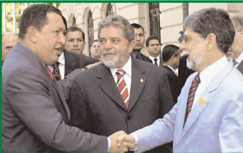
Nel 2003, Amorim con il presidente venezuelano Hugo Chávez e, al centro, l'allora presidente brasiliano Luiz Inácio Lula da Silva