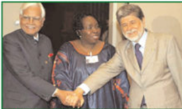
K. Natwar Singh, ministro degli Esteri indiano, Nkosazana Dlamini-Zuma, presidente della Commissione dell'Unione africana, e Celso Amorim