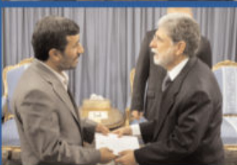
Nella foto in alto, Amorim con il capo dello staff del presidente iraniano Hassan Rouhani; in basso con Mahmud Ahmadinejad, presidente iraniano dal 2005 al 2013

di almeno venti anni, se non quaranta. Negli ultimi dieci anni stiamo vivendo una recessione, ma ciò accade, è un momento difficile per il mondo intero. Il Brasile è riuscito ad evitare che questa crisi, iniziata nel 2009, lo colpisse in maniera profonda, ma adesso è giunta anche da noi e dobbiamo affrontarla, è il momento di dimostrare la nostra resilienza, la capacità di adattarci e cambiare nonostante gli ostacoli. Ci riusciremo, perché il Brasile, da quando sono una persona adulta, è riuscito a vincere tre grandi ostacoli: il primo è stato l'autoritarismo, la politica della dittatura militare; il secondo, quello dell'instabilità economica, l'inflazione per quasi 50 anni; il terzo, ancora in corso, quello della riduzione delle disuguaglianze. Il Brasile non è un Paese povero, bensì di reddito medio nell'insieme, ma è un Paese molto «disuguale»: questa disuguaglianza sta diminuendo molto soprattutto con i Governi di Lula e Dilma. Con Lula si notò in misura maggiore in quanto era quella un'epoca di grande sviluppo economico, ma il processo continua. Sì, il popolo brasiliano è più ricco, perché un maggior numero di persone partecipano al mercato, arrivano all'università, per tale ragione hanno accesso a impieghi migliori, e questo è il cambiamento più grande.