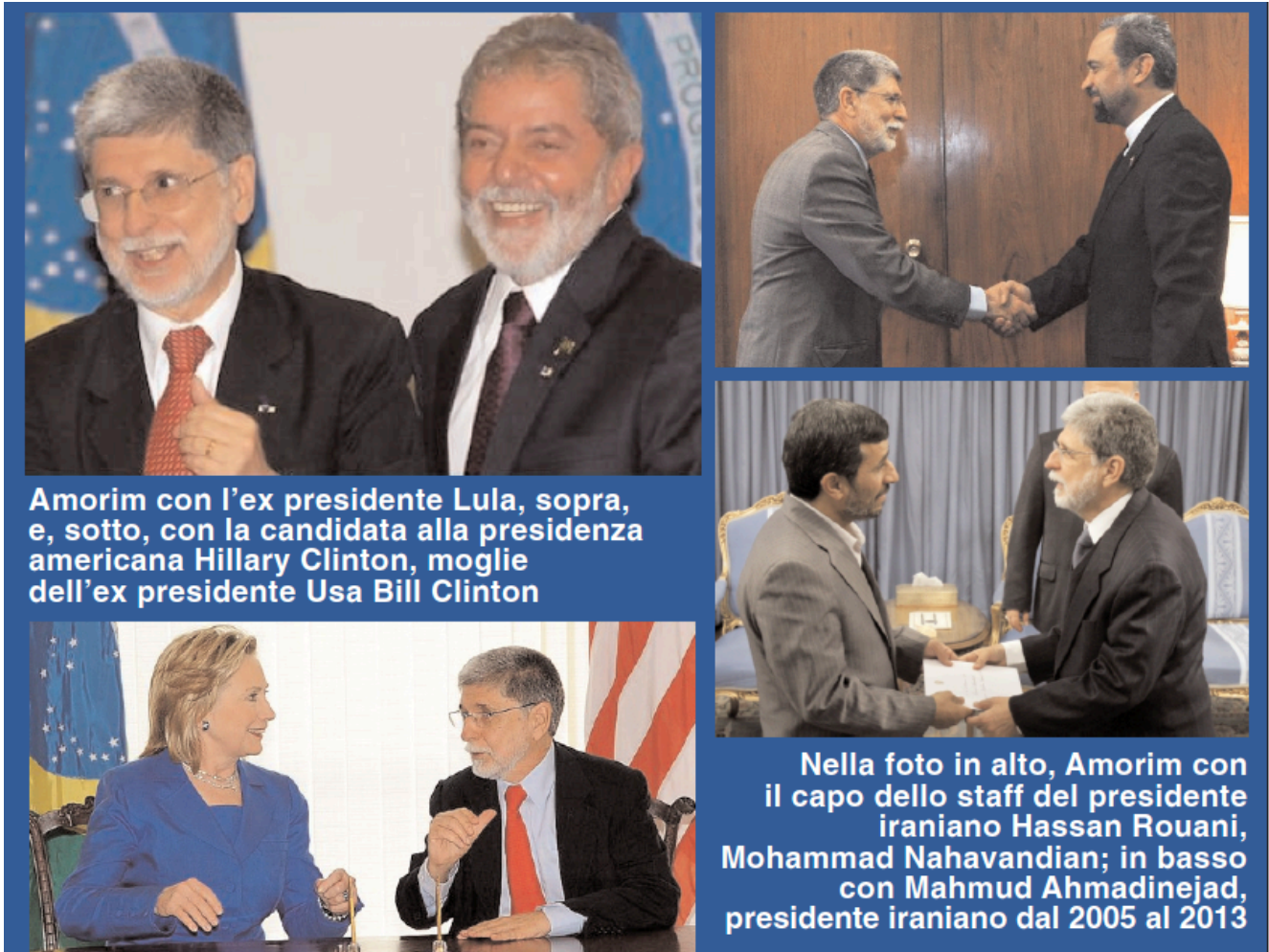
Amorim con l'ex presidente Lula, sopra, e, sotto, con la candidata alla presidenza americana Hillary Clinton, moglie dell'ex presidente Usa Bill Clinton