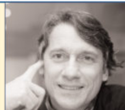
La mostra 'Dancer inside Brazil' fino al 18 marzo nella Galleria Candido Portinari dell'Ambasciata del Brasile a Roma, Piazza Navona

R. Studiavo ed ero appassionato di filosofia, e a quei tempi il cinema non era solo arte: in Brasile esso costituiva un vero e proprio strumento di cambiamento sociale, di trasformazione. Il cinema ha fatto sì che i paulisti e i carioca, gli abitanti di San Paolo e di Rio de Janeiro, conoscessero il «Nordest» del Brasile e la sua povertà, ad esempio. Anche la politica era molto legata al cinema. Entrai però nella carriera diplomatica che ho condotto, insieme all'essere ministro, per oltre 50 anni. Ora tengo lezioni, partecipo a conferenze alle quali sono invitato o commissioni, anche nell'ambito delle Nazioni Unite, su questioni legate a problemi globali di salute ma anche calcio, perché siamo sempre brasiliani; sono stato capo dell'Osservatorio elettorale dell'Oea, l'Organizzazione degli Stati americani ad Haiti. Un libro è costituito da una prefazione, una storia ed un epilogo: io mi trovo nella fase dell'epilogo, ho sempre lavorato per lo Stato e per organismi internazionali, ma non lavorerei, pur rispettandola, in un'impresa privata. Sono servitore dello Stato. □