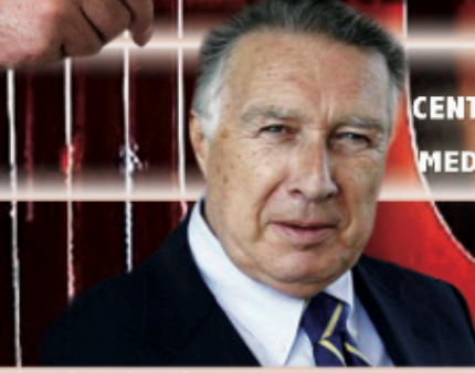
DOMENICO ALESSIO: CENTRO ALL'AVANGUARDIA NELLA PROCREAZIONE MEDICALMENTE ASSISTITA