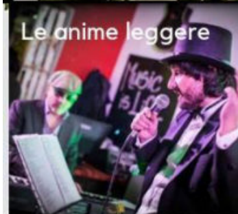
Le anime leggere