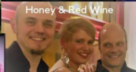
Honey & Red Wine