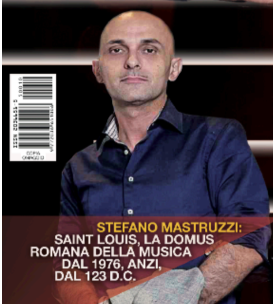
STEFANO MASTRUZZI: SAINT LOUIS, LA DOMUS ROMANA DELLA MUSICA DAL 1976, ANZI, DAL 123 D.C.