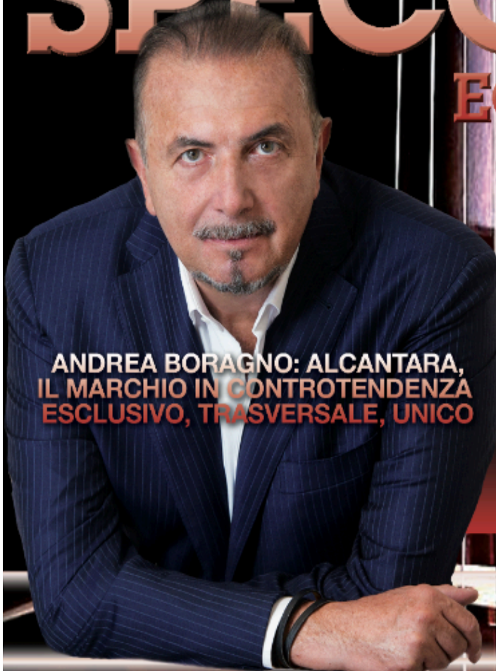
ANDREA BORAGNO: ALCANTARA, IL MARCHIO IN CONTROTENDENZA ESCLUSIVO, TRASVERSALE, UNICO