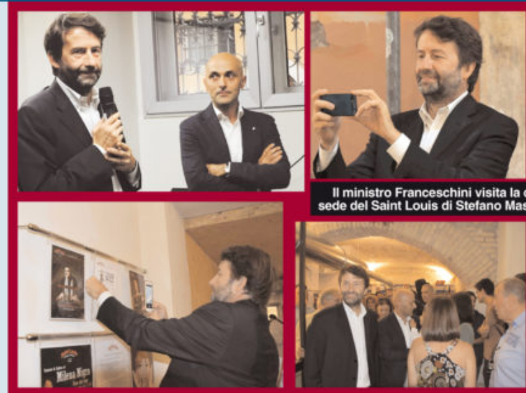
Il ministro Franceschini visita la quarta sede del Saint Louis di Stefano Mastruzzi

« dobbiamo affiancare la contemporaneità al ruolo primario che ci ha dato la storia: tutelare e valorizzare il patrimonio materiale e immateriale delle generazioni che ci hanno preceduto. Il jazz italiano è punto di riferimento europeo fatto di maestri e talenti che combattono le difficoltà di far diventare la propria vocazione un lavoro. Ci riescono, ma fuori dai nostri confini nazionali»