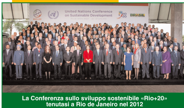
La Conferenza sullo sviluppo sostenibile «Rio+20» tenutasi a Rio de Janeiro nel 2012

«M odificare lo stile di vita e i comportamenti individuali è l'unica strada per salvare il pianeta dall'emergenza ambientale. Non è facile: il comportamento è frutto di meccanismi spesso incontrollabili o difficilmente trasformabili. Oltre a ciò, la profonda sfiducia del singolo nel sistema e la resistenza delle istituzioni rende ancora più ardua l'impresa affidata agli psicologi ambientali»