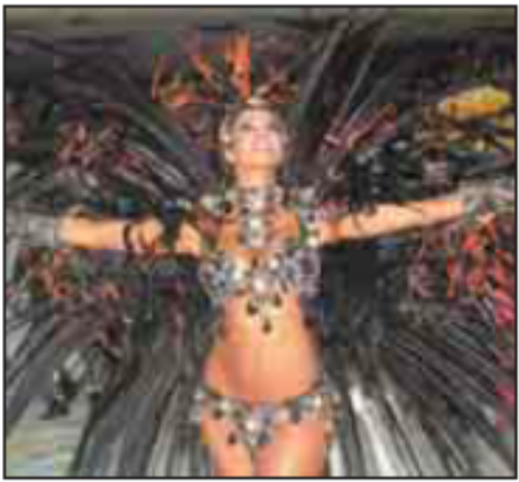
Samba durante una festa brasiliana