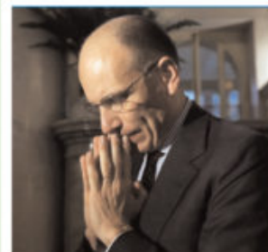
Mario Monti ed Enrico Letta