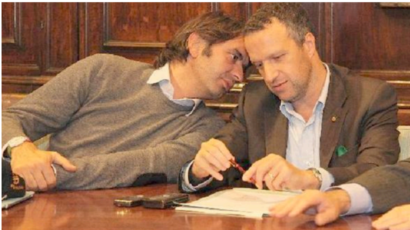
Federico Sboarina e Flavio Tosi

comunale. Avevo chiuso la gara, avevo assegnato il progetto; alla fine del mandato la nuova amministrazione starà ancora parlando di come risolvere la questione. La grande contraddizione è che il mio operato è stato votato a suo tempo dallo stesso Sboarina, che componeva la mia coalizione. Un altro esempio: avevamo previsto la trasformazione commerciale di una serie di immobili, la nuova Giunta ha dichiarato che la impedirà.