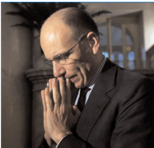
Mario Monti ed Enrico Letta