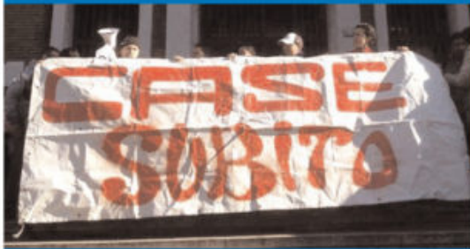
Alcune delle moltissime proteste che sono effettuate contro ogni Governo, che sempre viene meno al diritto alla casa, tassando eccessivamente il cittadino nel suo esercizio

«Lo smagrimento della macchina pubblica è una delle vie da seguire, come nel caso dei Consorzi di bonifica le cui funzioni sono necessarie per il mantenimento del territorio e per evitare eventi catastrofici, ma che nel tempo sono diventati 'stipendifici' e hanno perso il senso primario per cui sono nati. Chiudere i Consorzi significa eliminare circa 110 consigli di amministrazione. Quanto risparmiato andrebbe all'assunzione di nuovi dipendenti e le funzioni potrebbero accorparsi ad altro ente dello Stato»