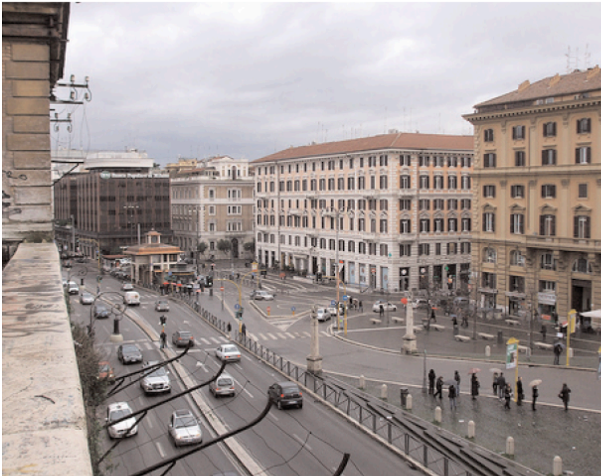
Piazzale Flaminio, a Roma, dove ha sede la Fiaip

D. Negli ultimi anni vi siete battuti, in tutte le sedi istituzionali, per la riforma della legge professionale n. 39 del 1989 e avete scommesso con forza, a difesa dell'intera categoria contro l'abusivismo professionale. A che punto siamo con la modifica dell'articolo 348 del Codice penale che inasprisce le pene per chi esercita abusivamente la professione di agente immobiliare, per la quale è richiesta una speciale abilitazione dello Stato? Si riuscirà ad approvare questa riforma già in questa legislatura? Saranno introdotte le sanzioni penali per coloro che esercitano abusivamente l'attività di mediazione ed operano nel comparto immobiliare, senza essere iscritti nel ruolo?