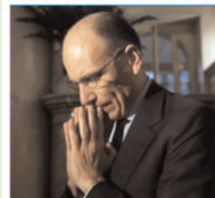
Mario Monti ed Enrico Letta