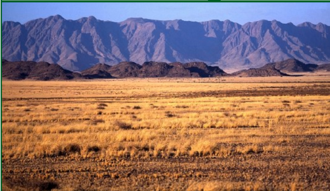
La savana kenyota

La psicologia ambientale ha, inoltre, preso atto di un fenomeno in grado di dare una netta sferzata al comportamento, le «epifanie ambientali», che si presentano all'individuo come una rivelazione improvvisa, repentina, che lo avvicinano al senso della natura, e lo inducono a modificare il proprio stile di vita in funzione di un'ecologicità cosciente. Si verifica, in questi casi, quel ritorno alla natura che gli psicologi ambientali auspicano, si ricuce il rapporto uomo-natura in funzione di quest'ultima e si prende atto della sua presenza, prima invisibile.