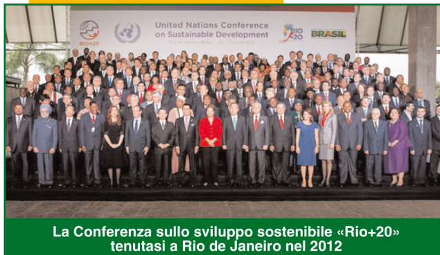
La Conferenza sullo sviluppo sostenibile «Rio+20» tenutasi a Rio de Janeiro nel 2012

«Modificare lo stile di vita e i comportamenti individuali è l'unica strada per salvare il pianeta dall'emergenza ambientale. Non è facile: il comportamento è frutto di meccanismi spesso incontrollabili o difficilmente trasformabili. Oltre a ciò, la profonda sfiducia del singolo nel sistema e la resistenza delle istituzioni rende ancora più ardua l'impresa affidata agli psicologi ambientali»