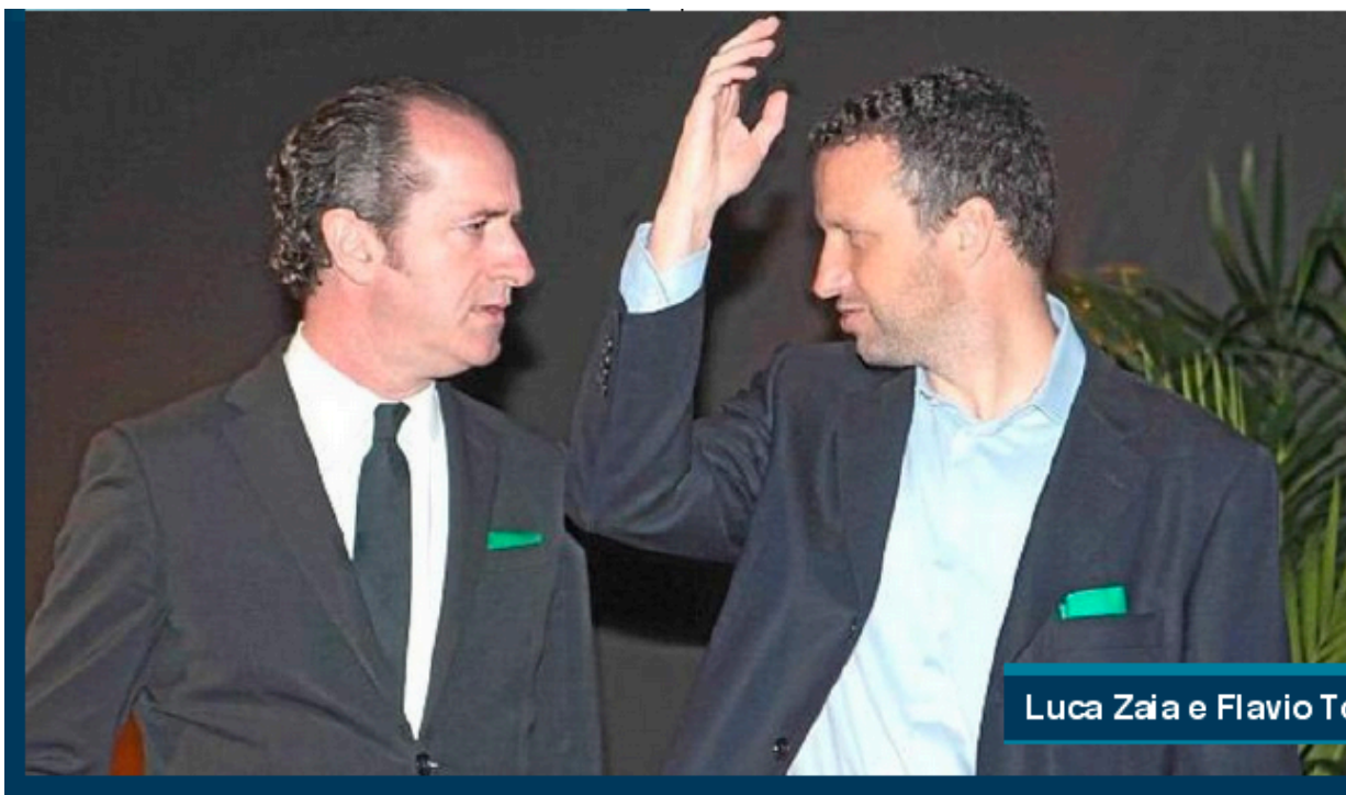
Luca Zaia e Flavio Tosi

D. Ragionando sui temi specifici del Veneto, sarebbe giusto in effetti che si prendesse la specialità dello Statuto?