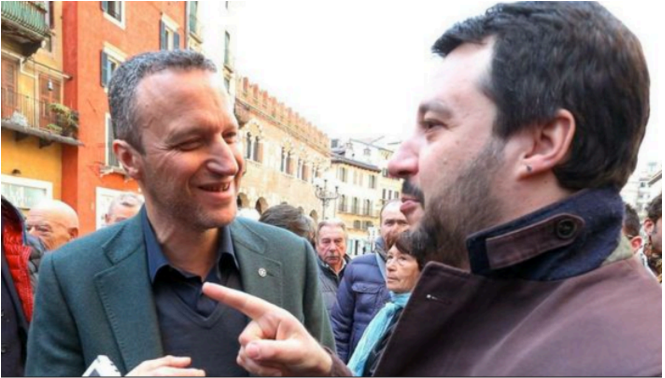
Flavio Tosi e Matteo Salvini