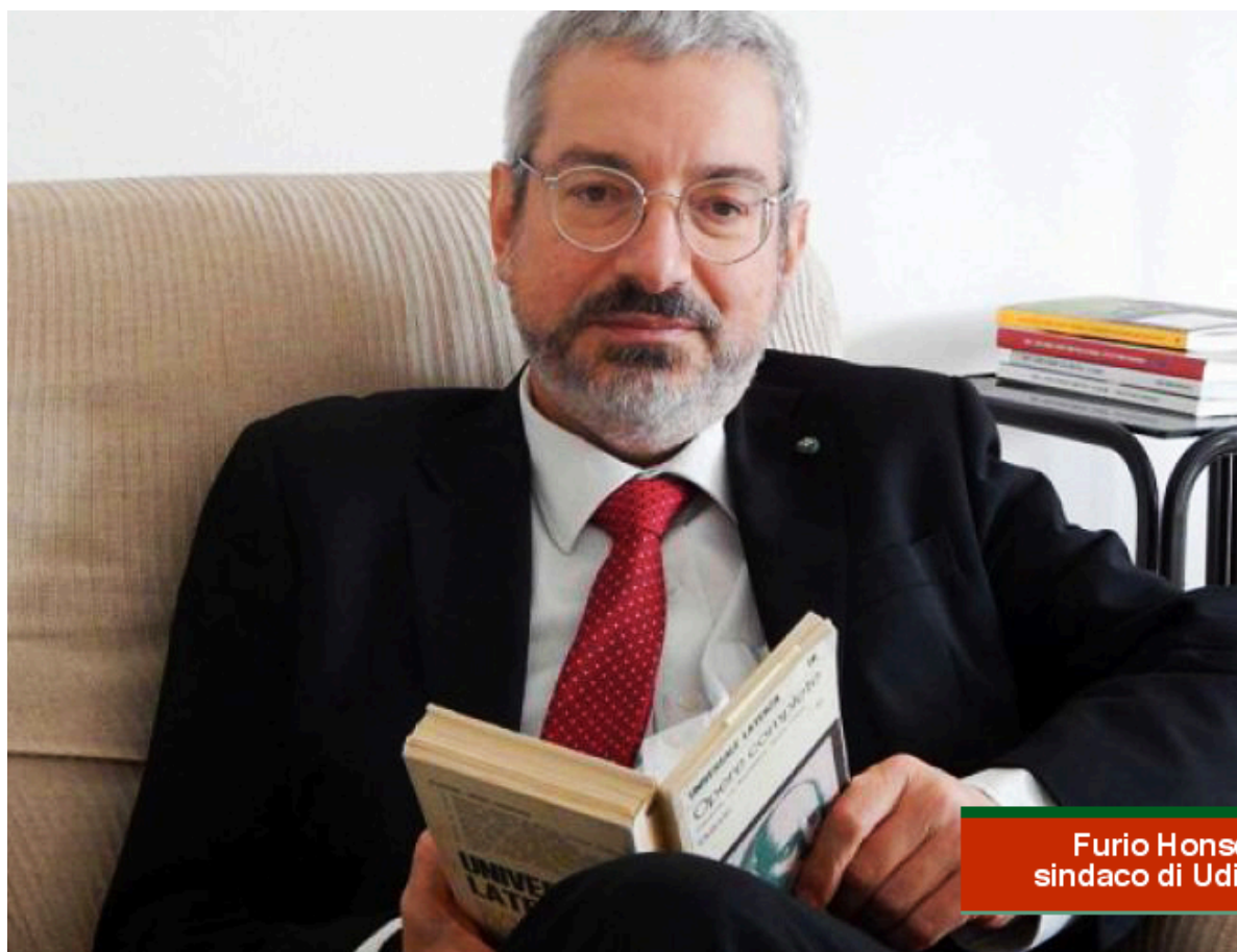
Furio Honsell, sindaco di Udine

I dieci anni per il doppio mandato dell'attuale sindaco Furio Honsell stanno per terminare: dal 28 aprile 2008 al 31 dicembre 2017 la città, che ha appena ospitato al Festival Mimesis i più grandi filosofi e pensatori italiani, è uno dei capoluoghi italiani dei diritti civili anche grazie a lui. Il caso di Eluana Englaro , costretta 17 anni in stato vegetativo per accanimento terapeutico; le unioni civili (è di Honsell la trascrizione del matrimonio di Adele Palmieri e Ingrid Owen prima che ci fosse una legge ad hoc), la protesta dei quattro dipendenti della Gros Market di Pradamano (sul tetto è salito anche il sindaco) , l'accoglienza dei rifugiati e dei vicini di casa. Honsell, nato a Genova, già rettore dell' Università di Udine , matematico e rigoroso scientifico, ora è pronto per la sfida alle regionali.