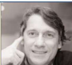
La mostra "Dancer inside Brazil" fino al 18 marzo nella Galleria Candido Portinari dell'Ambasciata del Brasile a Roma, Piazza Navona

R. Studiavo ed ero appassionato di filosofia, e a quei tempi il cinema non era solo arte: in Brasile esso costituiva un vero e proprio strumento di cambiamento sociale, di trasformazione. Il cinema ha fatto sì che i paulisti e i carioca, gli abitanti di San Paolo e di Rio de Janeiro, conoscessero il «Nordest» del Brasile e la sua povertà, ad esempio. Anche la politica era molto legata al cinema. Entrai però nella carriera diplomatica che ho condotto, insieme all'essere ministro, per oltre 50 anni. Ora tengo lezioni, partecipo a conferenze alle quali sono invitato o commissioni, anche nell'ambito delle Nazioni Unite, su questioni legate a problemi globali di salute ma anche calcio, perché siamo sempre brasiliani; sono stato capo dell'Osservatorio elettorale dell'Oea, l'Organizzazione degli Stati americani ad Haiti. Un libro è costituito da una prefazione, una storia ed un epilogo: io mi trovo nella fase dell'epilogo, ho sempre lavorato per lo Stato e per organismi internazionali, ma non lavorerei, pur rispettandola, in un'impresa privata. Sono servitore dello Stato. □