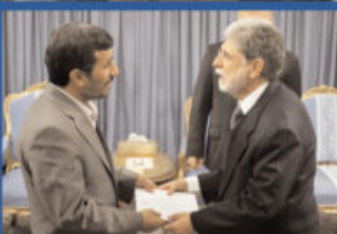
Nella foto in alto, Amorim con il capo dello staff del presidente iraniano Hassan Rouhani, Mohammad Nahavandian; in basso con Mahmud Ahmadinejad, presidente iraniano dal 2005 al 2013

di almeno venti anni, se non quaranta. Negli ultimi dieci anni stiamo vivendo una recessione, ma ciò accade, è un momento difficile per il mondo intero. Il Brasile è riuscito ad evitare che questa crisi, iniziata nel 2009, lo colpisse in maniera profonda, ma adesso è giunta anche da noi e dobbiamo affrontarla, è il momento di dimostrare la nostra resilienza, la capacità di adattarci e cambiare nonostante gli ostacoli. Ci riusciremo, perché il Brasile, da quando sono una persona adulta, è riuscito a vincere tre grandi ostacoli: il primo è stato l'autoritarismo, la politica della dittatura militare; il secondo, quello dell'instabilità economica, l'inflazione per quasi 50 anni; il terzo, ancora in corso, quello della riduzione delle disuguaglianze. Il Brasile non è un Paese povero, bensì di reddito medio nell'insieme, ma è un Paese molto «disuguale»: questa disuguaglianza sta diminuendo molto soprattutto con i Governi di Lula e Dilma. Con Lula si notò in misura maggiore in quanto era quella un'epoca di grande sviluppo economico, ma il processo continua. Sì, il popolo brasiliano è più ricco, perché un maggior numero di persone partecipano al mercato, arrivano all'università, per tale ragione hanno accesso a impieghi migliori, e questo è il cambiamento più grande.