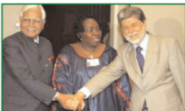
K. Natwar Singh, ministro degli Esteri indiano, Nkosazana Dlamini-Zuma, presidente della Commissione dell'Unione africana, e Celso Amorim