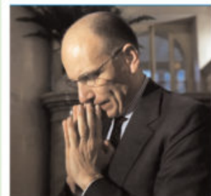
Mario Monti ed Enrico Letta