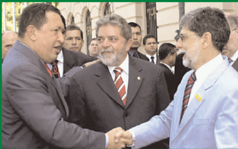
Nel 2003, Amorim con il presidente venezuelano Hugo Chávez e, al centro, l'allora presidente brasiliano Luiz Inácio Lula da Silva