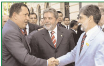
Nel 2003, Amorim con il presidente venezuelano Hugo Chávez e, al centro, l'allora presidente brasiliano Luiz Inácio Lula da Silva