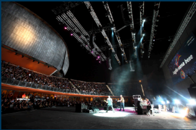
Due immagini della Cavea dell'Auditorium e, in alto a sinistra, l'architetto Renzo Piano

Domanda. Benvenuto a Roma, benvenuto all'Auditorium. Cosa significa per lei essere qui?