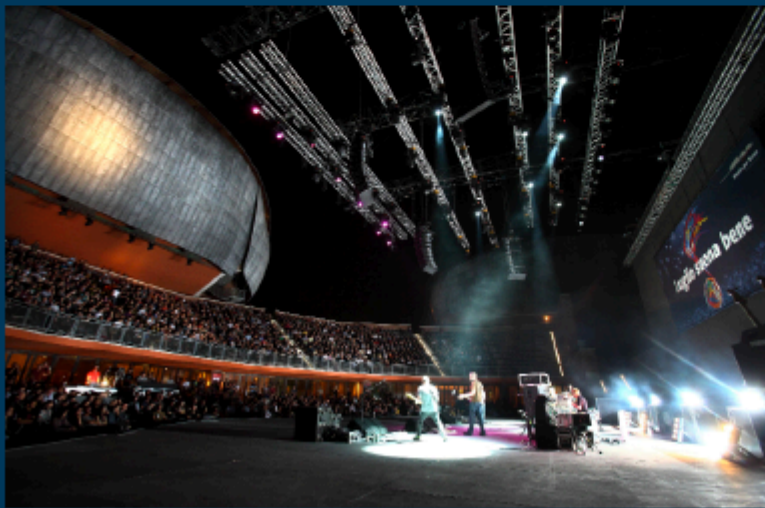
Due immagini della Cavea dell'Auditorium e, in alto a sinistra, l'architetto Renzo Piano

Domanda. Benvenuto a Roma, benvenuto all'Auditorium. Cosa significa per lei essere qui?