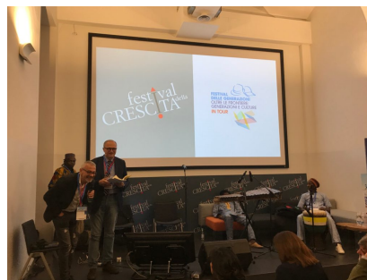
Festival della Crescita 2017