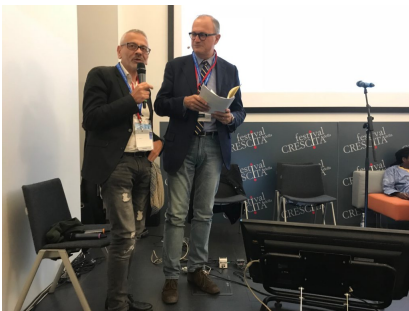
Festival della Crescita 2017