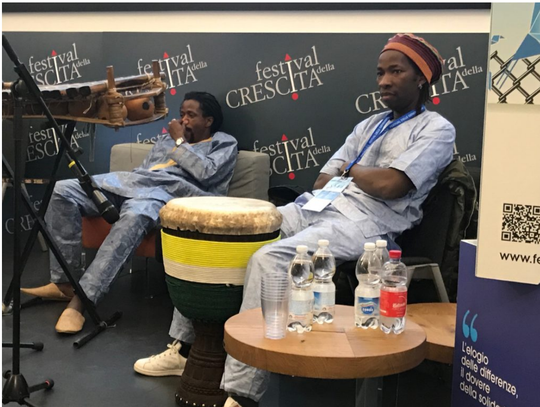
Un momento sul palco del Festival della Crescita 2107