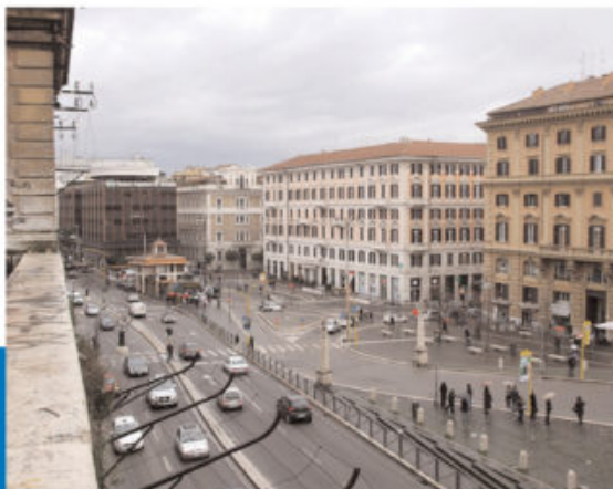
Piazzale Fiaminiano, a Roma, dove ha sede la Fiaip

U n futuro professionale basato sulla formazione, la crescita e lo sviluppo di nuovi servizi, un timore relativo alla crescente digitalizzazione dei processi di vendita, la paura, molto più concreta che la professionalità dell'agente immobiliare possa essere penalizzata dall'ingresso di nuovi operatori nell'intermediazione rappresentati, in particolare, da due grandi banche.