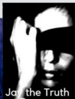
Jay the Truth Rapper