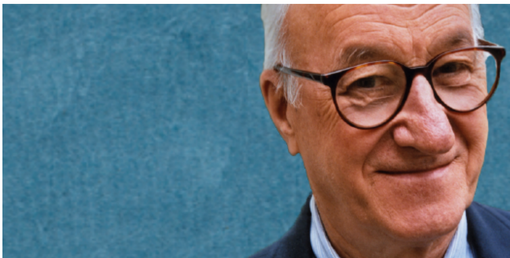
Albert Bandura, studioso dell'aggressività e fautore degli esperimenti sul pupazzo Bobo

La teoria degli indizi aggressivi è applicabile in Paesi quali gli Stati Uniti d'America, dove le armi possono essere acquistate, il nuovo presidente è favorevole al loro uso – in questo modo ampliando la motivazione dei cittadini a possederle se non altro per potersi difendere da altri che ne abbiano comprate – e non a caso nel Paese sono molto comuni le stragi nelle scuole generate dagli stessi studenti. In questo anche i media hanno un'elevata responsabilità, ma per dare atto di questo a breve mi soffermerò sugli studi di Bandura.