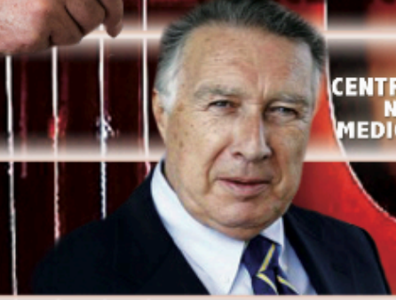
DOMENICO ALESSIO: CENTRO ALL'AVANGUARDIA NELLA PROCREAZIONE MEDICALMENTE ASSISTITA